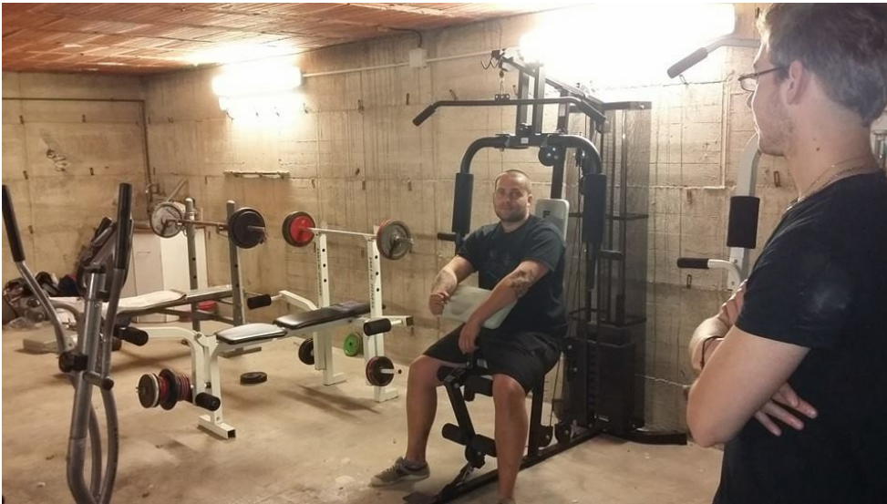
Ci-dessus la salle principale de la maison louée, et ci-contre la salle de musculation et sport de combat.